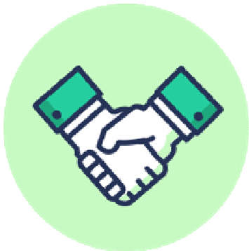
お客様からの信頼