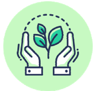
社会・地域への貢献